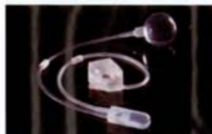
写真1 人工尿道括約筋

人工尿道括約筋の治療対象となるのは、尿道括約筋の機能低下から尿失禁となった男性患者だ。尿失禁の手術としては、ほかに尿道を恥骨側に人工のテープで吊り上げるスリング術がある。スリング術は女性の尿失禁では重度でも効果が確認されている。一方、「男性の場合、中等